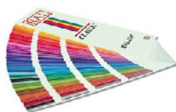
disponível em todas as cores RAL